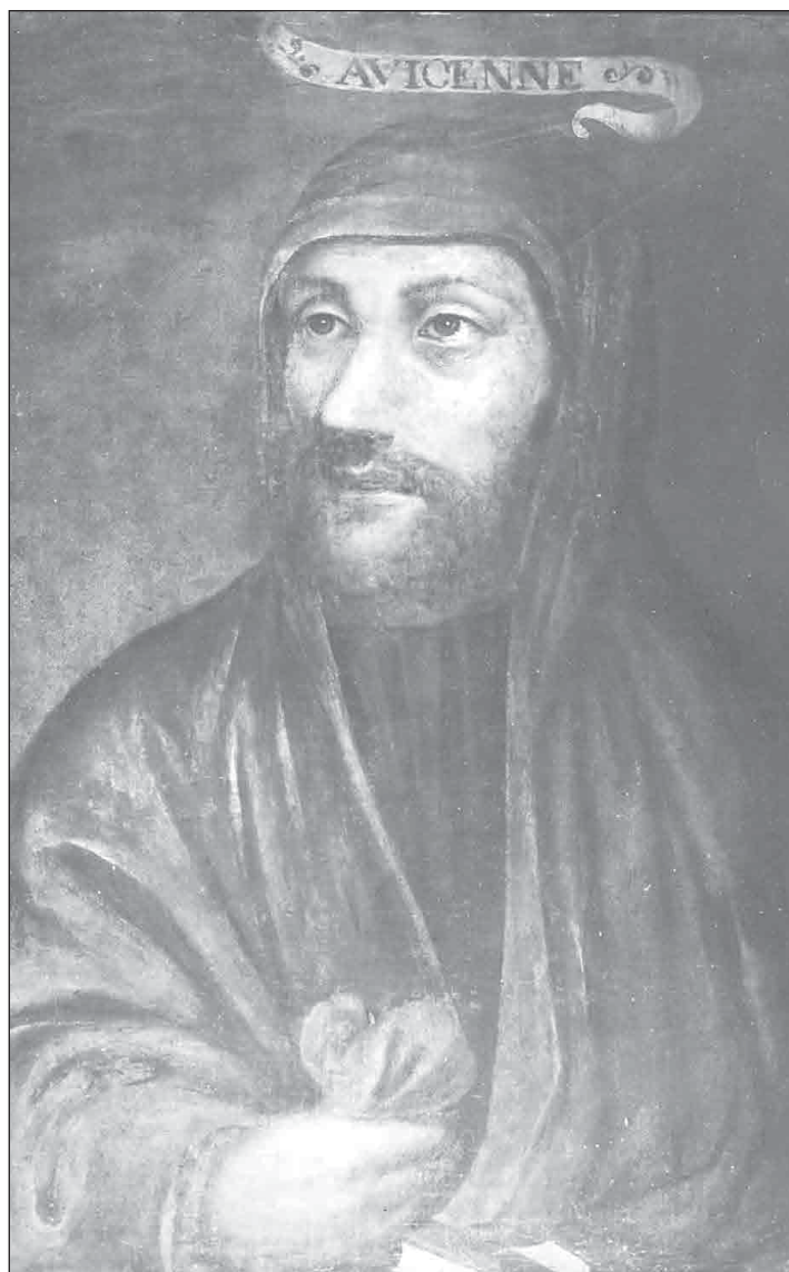
Портрет на Авицена от 1271 г. (неизвестен автор)