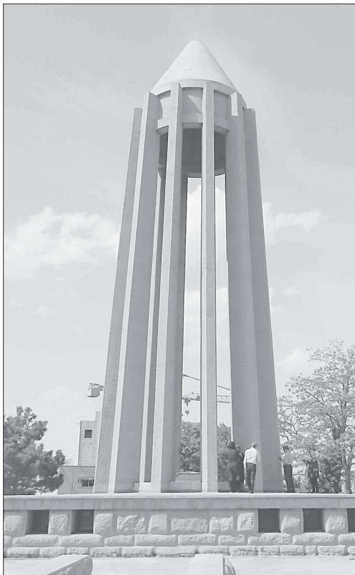
Мавзолеят на Авицена в Хамадан, Иран