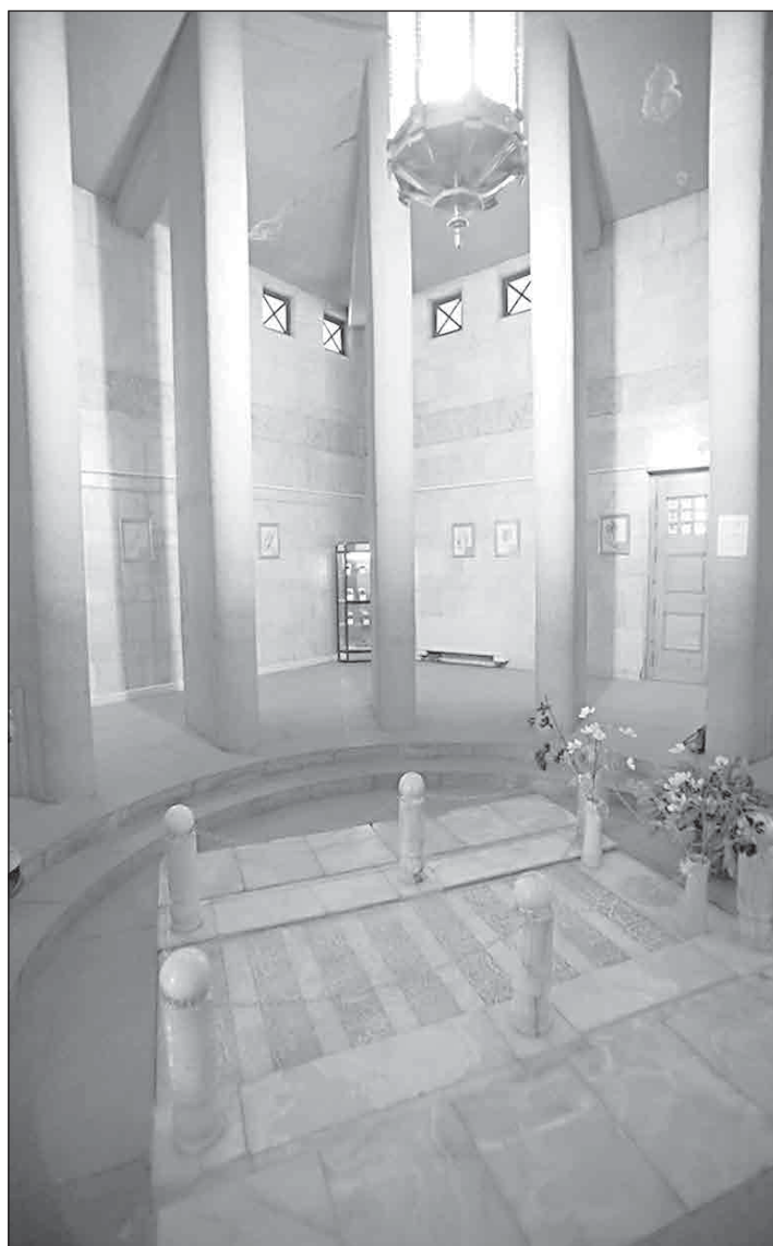
Мавзолеят на Ибн Сина отвътре